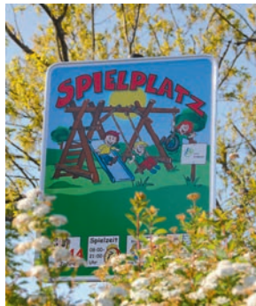
UNSER EINSATZ für die Vereinbarkeit von Familie und Beruf

Breit gefächertes Kindergartenangebot und Ganztagschule