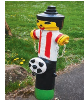
UNSERE JUGEND Angebote für Jugendliche verbessern

Unterstützung der Jugend- arbeit in den Vereinen