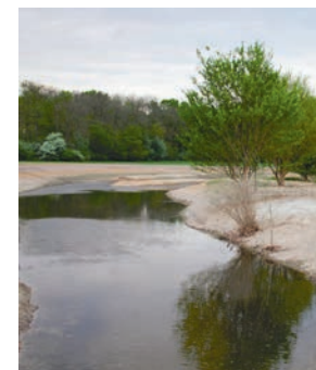
UNSER ENGAGEMENT für weitere Biotopvernetzung